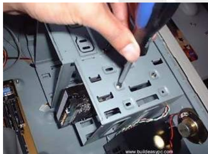
Slika 1: Privijačenje s vijaki