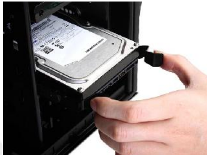
Slika 2: Vstavljanje diska na vodilih