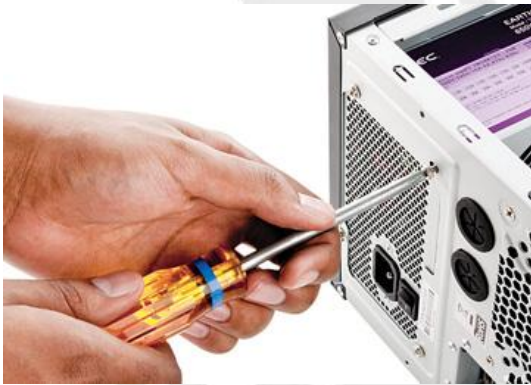
Slika 1 : Privijačite vse vijake