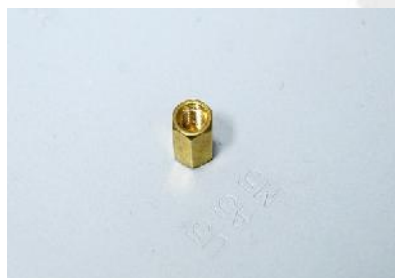
Slika 1: Primerni distančniki v ohišju