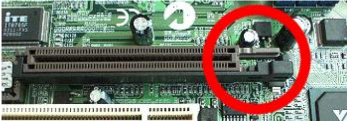
Slika 1: Plastični zatič za zaščito