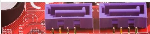
Slika 1: Priklop podatkovnega in napajalnega kabla Slika 2: Podatkovni kabel, ki povezuje osnovno ploščo.

Pazite da pravilno obrnete podatkovni kabel